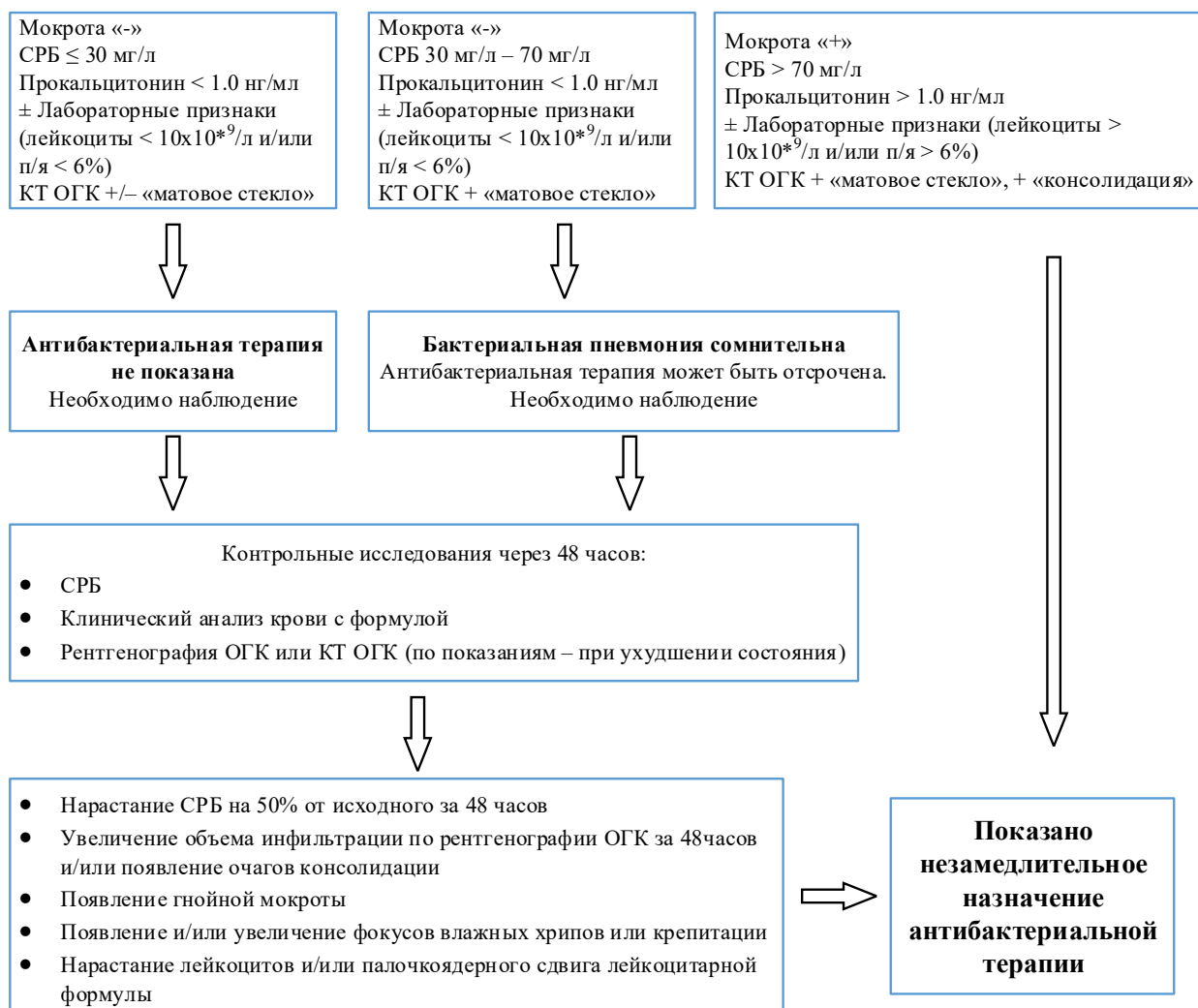
Рисунок 2. Алгоритм принятия решения о назначении антибактериальной терапии при SARS-CoV-2 – ассоциированном повреждении легких у госпитализированных пациентов с COVID-19/подозрением на COVID-19.

Данный алгоритм позволит с большей вероятностью диагностировать присоединение вторичной бактериальной пневмонии и своевременно назначить антибактериальную терапию.